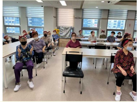
음악/신체 헤어밴드를 착용하시고 운동하시어 더욱 즐 겁게 하셨습니다.