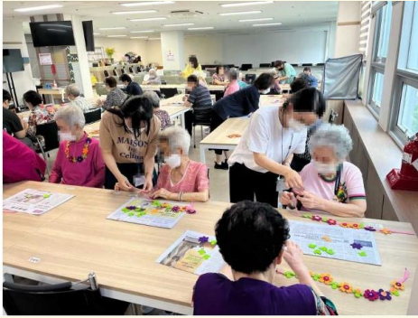
인지활동 부직포를 사용하여 목걸이를 만들시고 직접 만든 목걸이를 걸어보시며 좋아하셨습니다.